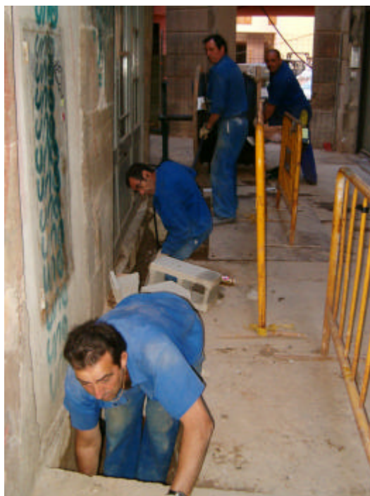
Fotografia núm. 5.

Tall estratigràfic de la Rasa 100, davant del núm. 12 del carrer dels Mestres Casals i Martorell, mirant al sud-oest.