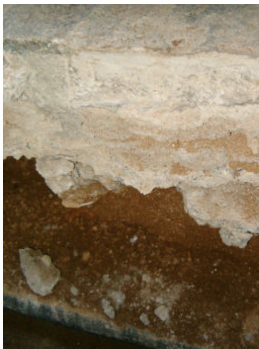
Fotografia núm. 5.

Tall estratigràfic de la Rasa 100, davant del núm. 12 del carrer dels Mestres Casals i Martorell, mirant al sud-oest.