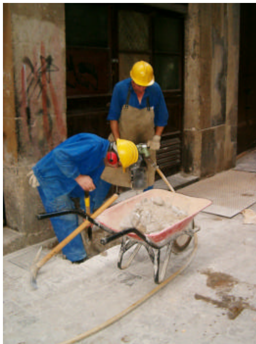
Fotografia núm. 2.

Vista general de la zona intervinguda, mirant al nord-oest.