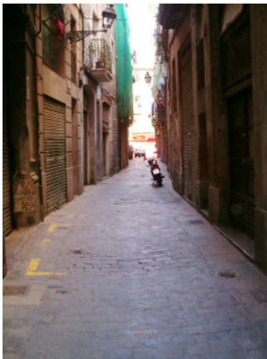
Fotografia núm. 1.

Vista general de la zona intervinguda, mirant al nord-oest.